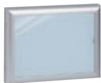
0 475 45