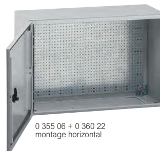
0 355 06 + 0 360 22 montage horizontal

Caractéristiques techniques p. 175 Visserie et fixation d'appareillage p. 209