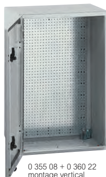
0 355 08 + 0 360 22 montage vertical