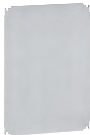
0 360 58