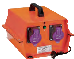
0 424 85

Les BSM portatifs, équipés de prises à brochage conforme à la norme IEC 60309-2 (réf. 0 524 01 ou 0 525 01) sont des ensembles monoblocs de distribution d'une très basse tension de sécurité (24 V) Protection du secondaire du transformateur par disjoncteur magnétothermique Transfo conforme à la norme IEC EN 61558-2-6, monophasé 50/60 Hz Isolant classe B Organe de commande marche/arrêt Classe II Double isolation Reçoivent les fiches TBT - 2P - 24 V Hypra