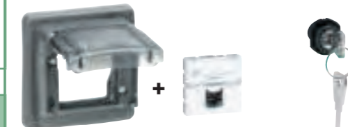
Exemple d'adaptateur réf. 0 539 49 recevant mécanisme Mosaic 2 modules