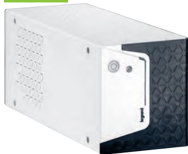
3 101 80

Onduleurs monophasés pour postes de travail, systèmes de sécurité, CCTV, terminaux de point de vente, applications domestiques... Protection contre les surtensions, les surcharges et les courts-circuits Gestion avancée en fonction du niveau de décharge de la batterie Auto-diagnostic et régulateur électronique de tension AVR intégrés Fonction de démarrage à froid Contrôle par microprocesseur Fonction USB intégrée pour que l'onduleur soit perçu par les ordinateurs ou les serveurs NAS comme une batterie externe Chargeur USB-1A (à partir de 800 VA) Note : les valeurs d'autonomie sont estimées en minutes et peuvent varier en fonction des caractéristiques de la charge, des conditions d'utilisation et de l'environnement Livré dans packaging auto-vendeur