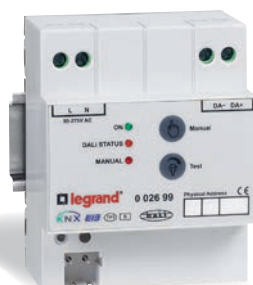
Contrôleur modulaire pour pilotage en variation de 16 groupes de luminaires DALI