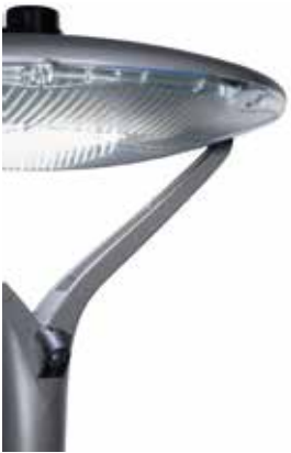
Oyo-valaisin erikseen tilattavalla PIR-tunnistimella