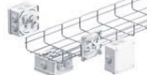
Kit IBP Cablofil