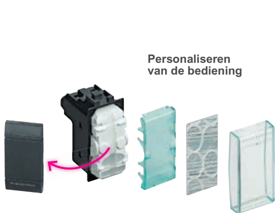
De originele toets afnemen en de transparante toets aanbrengen met respect voor de volgorde van montage.