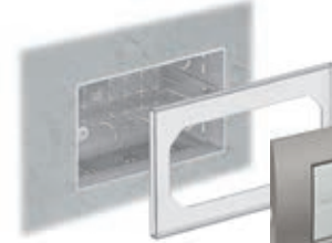
Inbouwdoos reeds geïnstalleerd