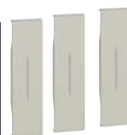
3 toetsen van 1 module (1 per functie)