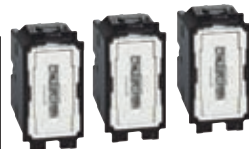
3 mechanismen van 1 module