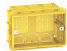
Metselwerk ref. 503E