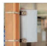
Paalbevestigingskit Ref. 036446/47/48/49