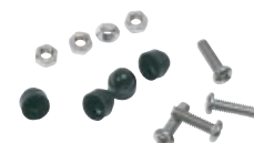
Zakje schroeven en bouten voor bevestiging contactdozen Ref. 052195