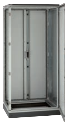
Voorbeeld van een vloerkast met scheidingschot ref. 048043