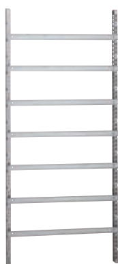
Voorbeeld van een frame uitgevoerd met stijpprofielen 047552 en rails 047728