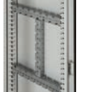
Multifunctionele dwarsbalken ref. 048024 en 2 x 048025