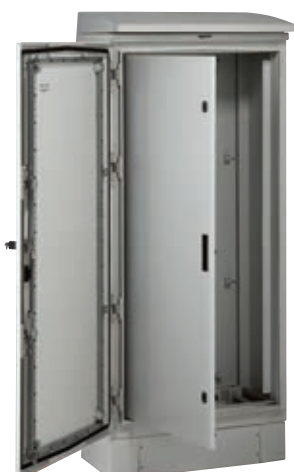
036286 + sokkel 036296 + binnendeur 036367 + dak 036297

Technische kenmerken zie www.ecatalog.be