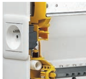
401850 + 077111 (blz. 1108)

Kasten kunststof klasse II - IP 40 – IK 09 met deur Zelfdovend volgens 750 °C Conform de norm IEC 60670-24 Geschikt voor het realiseren van verdeelborden conform IEC 61439-3