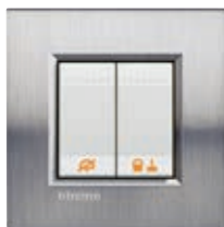
LN4653 + manettes + plaque Acier Brossé LNA4802ACS