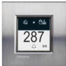
LN4651 + plaque Acier Brossé LNA4802ACS