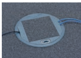
088127 avec moquette