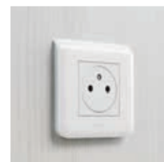
Prise 2P + T plat