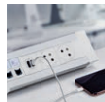
Bloc de bureau (p. 1042)