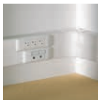
Goulotte DLP (p. 971)