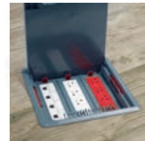
Boîte de sol (p. 1054)