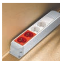
Bloc nourrice (p. 1044)