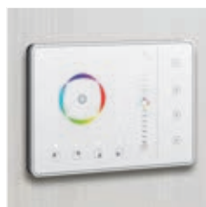
Commande tactile avec 4 scénarios

Plus de 200 fonctions encore plus innovantes pour équiper les bureaux et lieux de travail