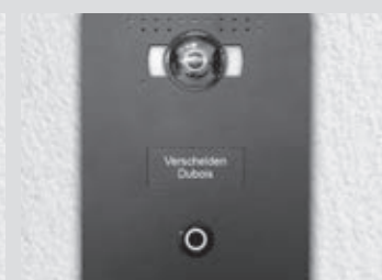
8- Porte-nom personnalisable par www.sfera-luna.com