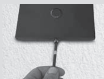
7- Fixer la plaque de finition au moyen de la vis