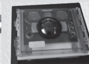
4- Montage de la camera et du plexi dans le support