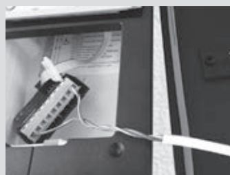
5- Connexion du bouton d'appel sur bornes 1 et C