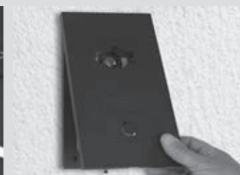
6- Placer la plaque de finition sur le support