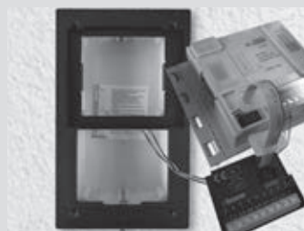
3- Connexion de l'interface de contact