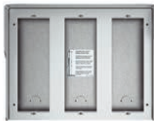
35069... 9 modules