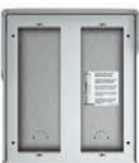
35066... 6 modules