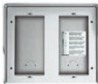
35064... 4 modules