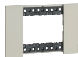
Plaque de finition réf. KA4803...