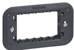
Support réf. K4703