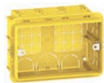
Boîte d'encastrement réf. 503E