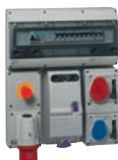
Réf. 057704 avec bouton d'arrêt d'urgence, socle de connecteur et socles de tableau verrouillés