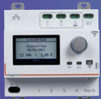
Ecocompteur connecté EMDX 3 with Netatmo réf. 412033