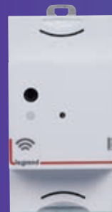
Module control (interface) EMDX 3 with Netatmo réf. 412181