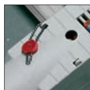
Possibilité de plombage