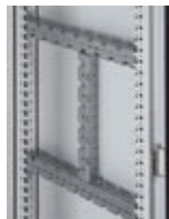
Traverses multi-fonctions réf. 048024 et 2 x 048025