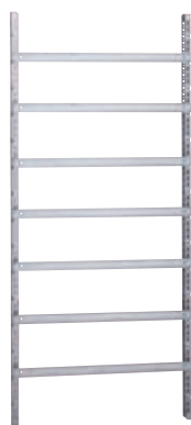
Exemple de châssis réalisé avec montants profilés 047552 et rails 047728