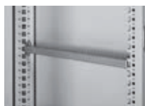
048015 Traverse horizontale