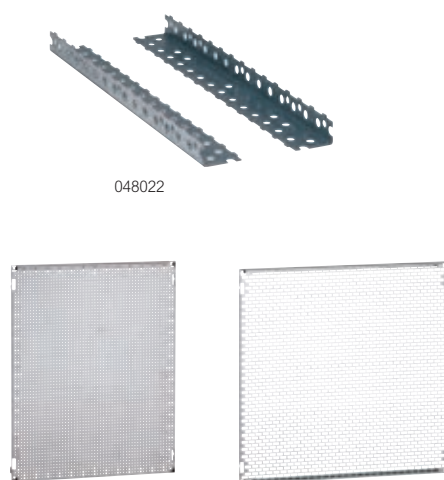
Plaques partielles : Lina 12,5 réf. 048143, perforées Lina 25 réf. 047496

Caractéristiques techniques voir www.ecataloge.be Visserie p. 373