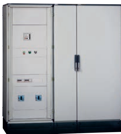
Armoire réf. 047253 x 2 + gaine à câble 047251