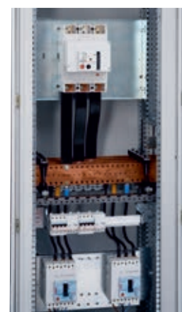
Armoire réf. 047253 sans plastron XL 3 , cadre plastron réf. 047482 et montants réf. 047480