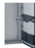
Accessoires (p. 371 et 372)