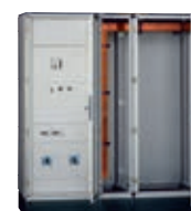
Distribution (p. 364)