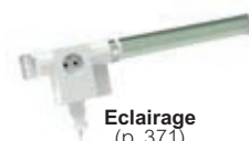
Eclairage (p. 371)