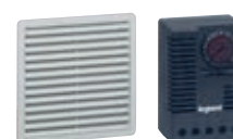
Gestion thermique (p. 374)