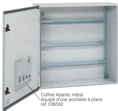
Coffret Atlantic métal équipé d'une pochette à plans réf. 036582