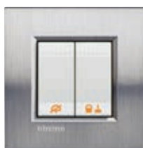
LN4653 + manettes + plaque Acier Brossé LNA4802ACS