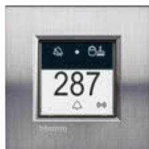
LN4651 + plaque Acier Brossé LNA4802ACS