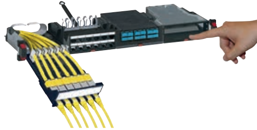
033755 équipée de connecteurs, de câbles et de cordons