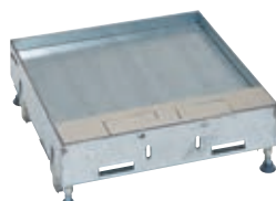
088105 + 088141

Tableau de choix p. 1060 Caractéristiques techniques p. 1066