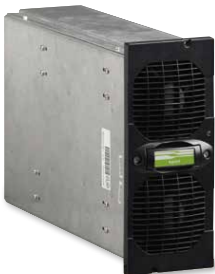
Modulo di potenza monofase compatto e leggero (solo 8,5 kg)