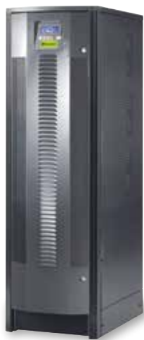
3 109 90