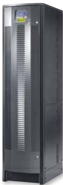
3 110 02