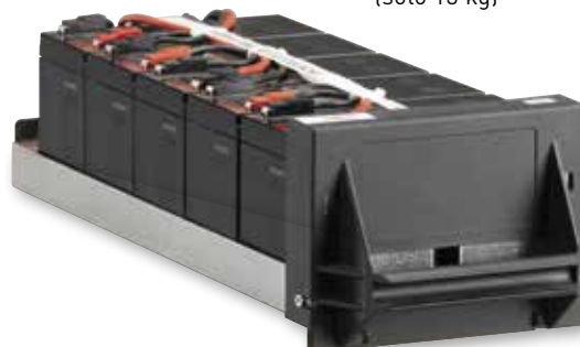
Modulo batterie maneggevole e semplice da installare (solo 13 kg)