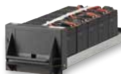
3 108 75