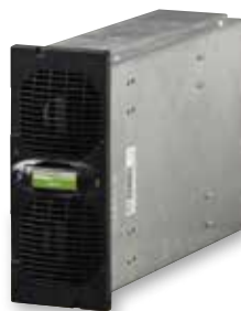
3 108 71