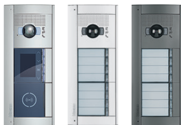
AllMétal AllWhite AllStreet