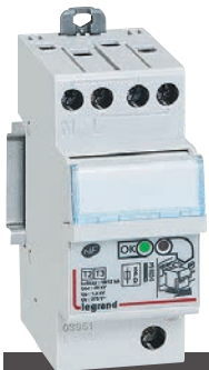
Parafoudre avec cassette débrochable : remplacement facilité