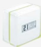
Thermostat Modulant Intelligent connecté Netatmo