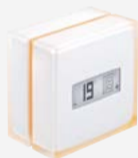
Thermostat Intelligent connecté Netatmo