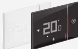
Thermostat connecté Smather with Netatmo Blanc - Noir